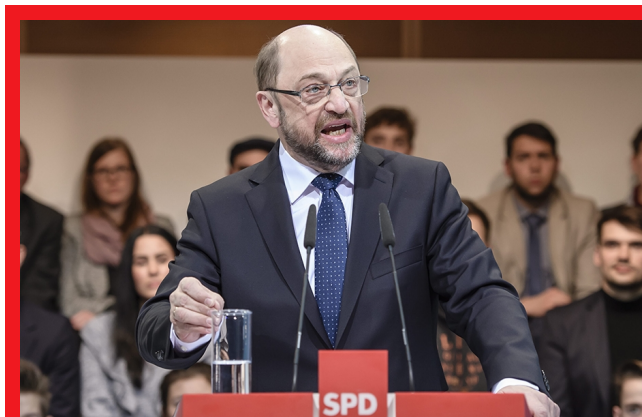
El candidato del SPD a las elecciones generales alemanas, Martin Schulz

La cúpula del Partido Socialdemócrata (SPD) designó ayer al expresidente del Parlamento Europeo Martin Schulz como candidato de la formación para las elecciones generales alemanas del próximo 24 de septiembre. La designación se produjo por unanimidad, seis días después de conocerse la renuncia del líder del SPD y vicecanciller de la gran coalición de Gobierno alemana, Sigmar Gabriel, a