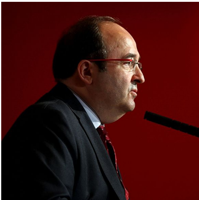
Miquel Iceta