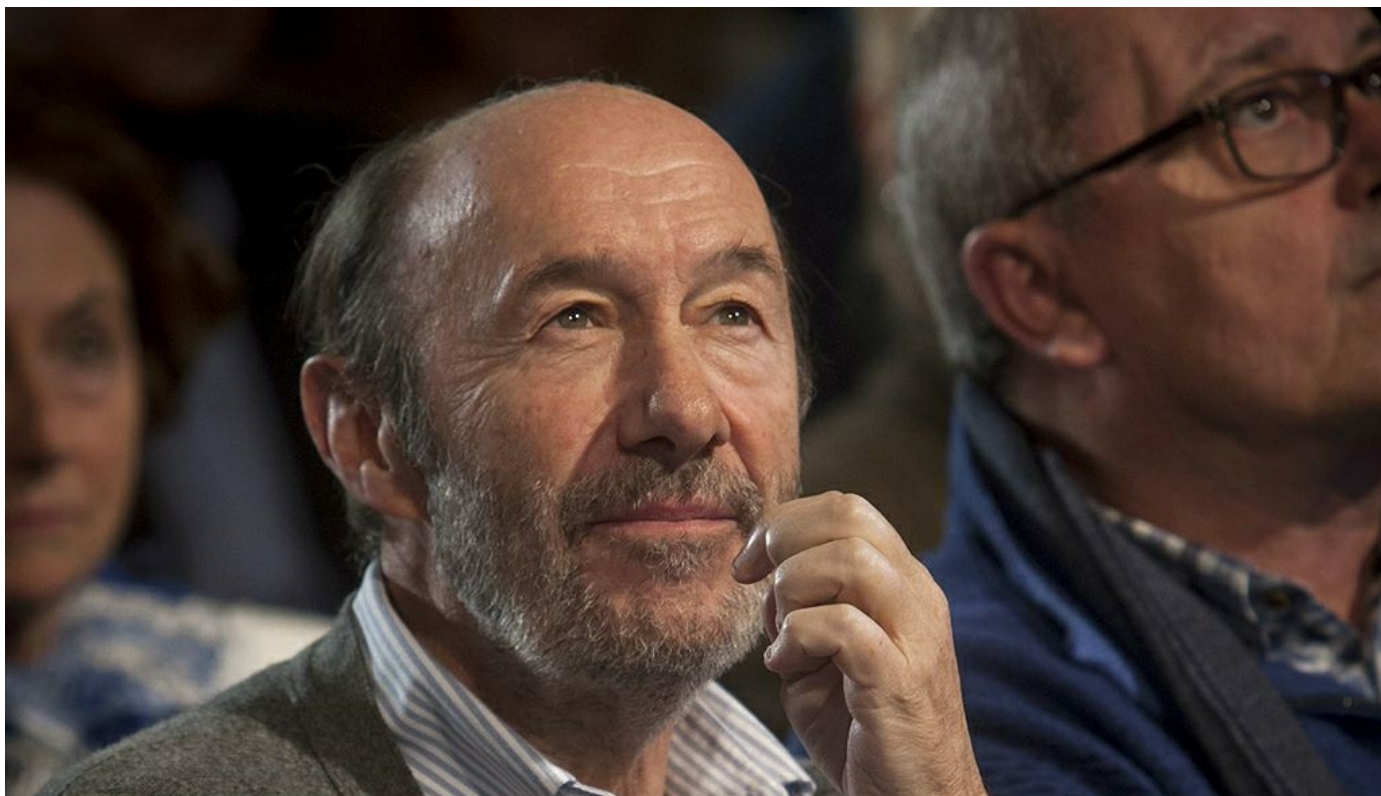
El exvicepresidente del Gobierno y ex secretario general del PSOE, Alfredo Pérez Rubalcaba