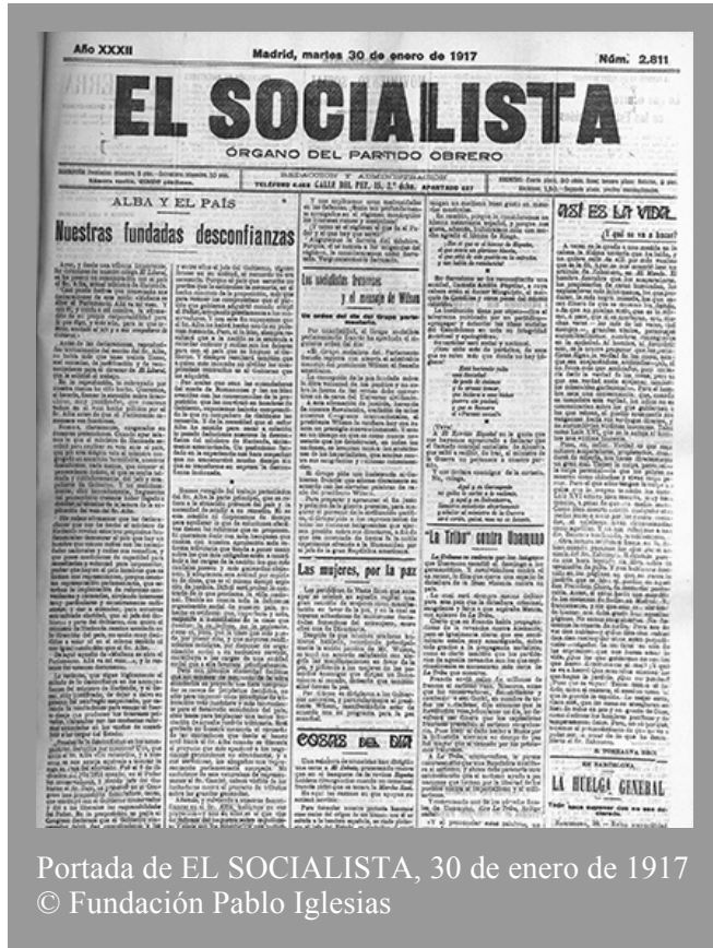
Portada de EL SOCIALISTA, 30 de enero de 1917 © Fundación Pablo Iglesias

Ayer, y desde una tribuna importante, las columnas de nuestro colega El Liberal , se ha puesto en comunicación con el país el Sr. Alba, actual ministro de Hacienda. Casi puede decirse que comenzaba sus declaraciones de este modo: "Mañana se abre el Parlamento. Allá va mi voto. Y con él, y unido a mi nombre, la afirmación de mi propia responsabilidad para lo que digo, y más aún, para lo que intento, asociado al jefe y a mis compañeros de Gobierno." © Fundación Pablo Iglesias