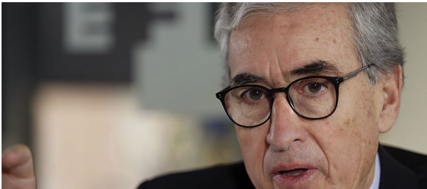
El jefe de los socialistas en la Eurocámara, Ramón Jáuregui